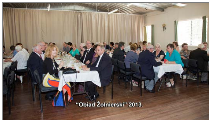
"Obiad Żołnierski" 2013.