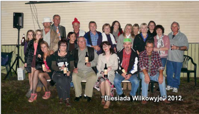
"Biesiada Wilkowyje" 2012.