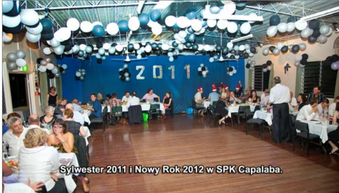
Sylwester 2011 i Nowy Rok 2012 w SPK Capalaba.

Mamy nadzieję, że tradycja organizowania Zabaw Sylwestrowych w Kole SPK Nr 8, będzie kontynuowana w przyszłości. Zwolennicy zabaw lubią do nas przyjeżdżać przede wszystkim dlatego, że plac wokół klubu, może pomieścić wiele samochodów, więc nie ma problemu z parkowaniem. Organizowane u nas Zabawy Sylwestrowe, nie mają również czasowego ograniczenia i często młodsza generacja, a czasami również i starsza, bawi się u nas do białego rana.