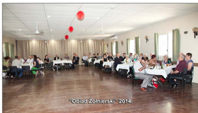
"Obiad Żołnierski" 2014.