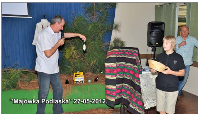
"Majówka Podlaska" 27-05-2012.