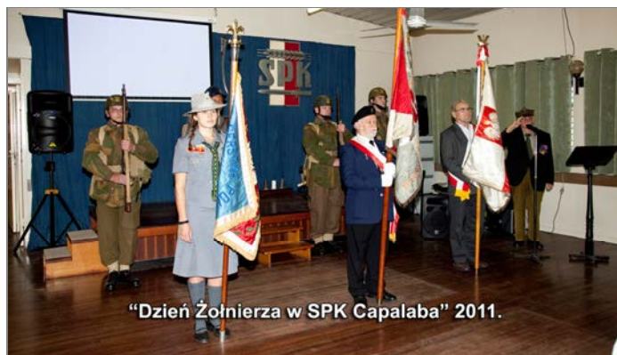
"Dzień Żołnierza w SPK Capalaba" 2011.