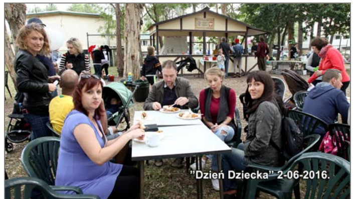
"Dzień Dziecka" 2-06-2016.