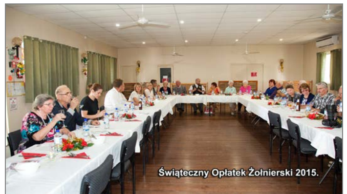
Świąteczny Oplatek Żołnierski 2015.