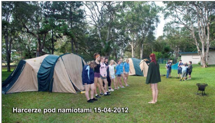
Harcerze pod namiotami 15-04-2012.