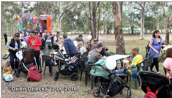
"Dzień Dziecka" 2-06-2016.