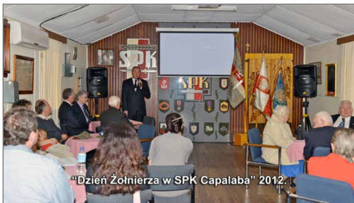
"Dzień Żołnierza w SPK Capalaba" 2012.