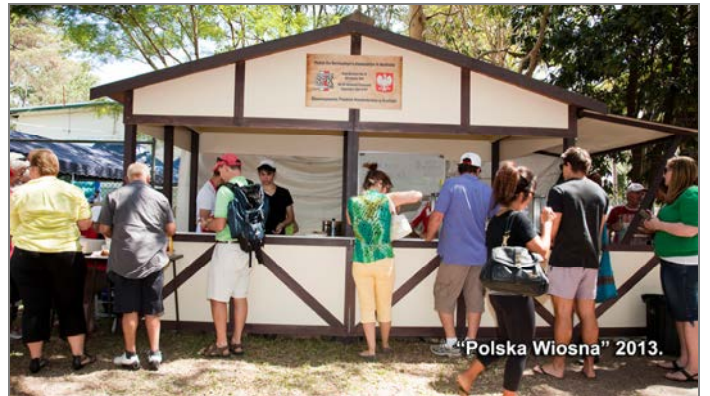
„Polska Wiosna” 2013.