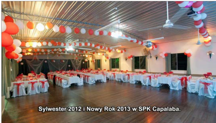
Sylwester 2012 i Nowy Rok 2013 w SPK Capalaba.