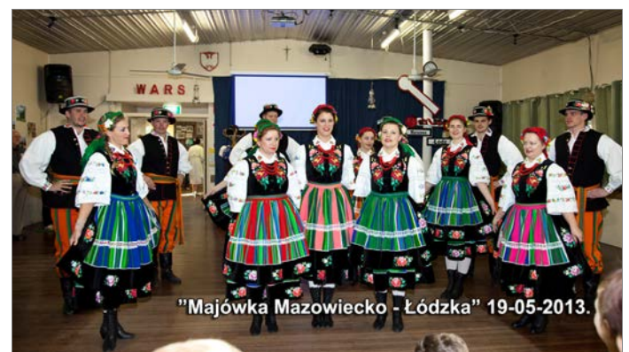
"Majówka Mazowiecko - Łódzka" 19-05-2013.