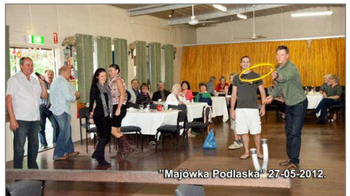
"Majówka Podlaska" 27-05-2012.