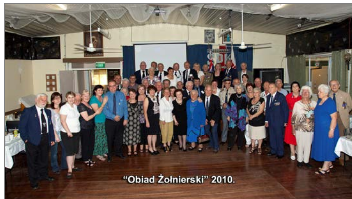
"Obiad Żołnierski" 2010.

Obiady Żołnierskie były organizowane w soboty i zawsze w ym samym dniu, w którym odbywały się Walne Zjazdy Delegatów SPK. Uczestniczyli w nich delegaci Kół SPK z całej Australii, zaproszeni goście i członkowie Koła SPK Nr 8 w Capalaba. Jedynym wyjątkiem był Obiad Żołnierski w 2017 roku, który został zorganizowany w Hobart na Tasmanii, bo właśnie tam odbył się Walny Zjazd Delegatów SPK. W ostatnich latach, gdy Walne Zjazdy odbywają się przez łącza internetowe, z organizowania Obiadów Żołnierskich, musieliśmy zrezygnować.