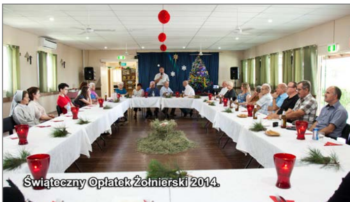
Świąteczny Oplatek Żołnierski 2014.