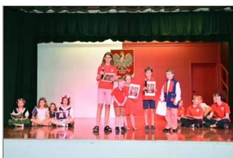
Polska Szkoła Brisbane.