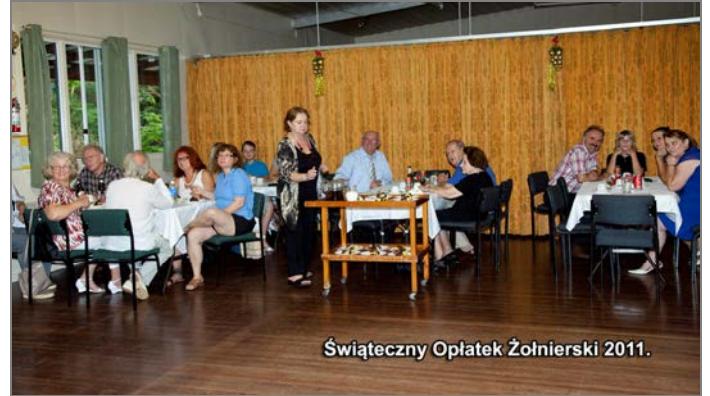
Świąteczny Oplatek Żołnierski 2011.