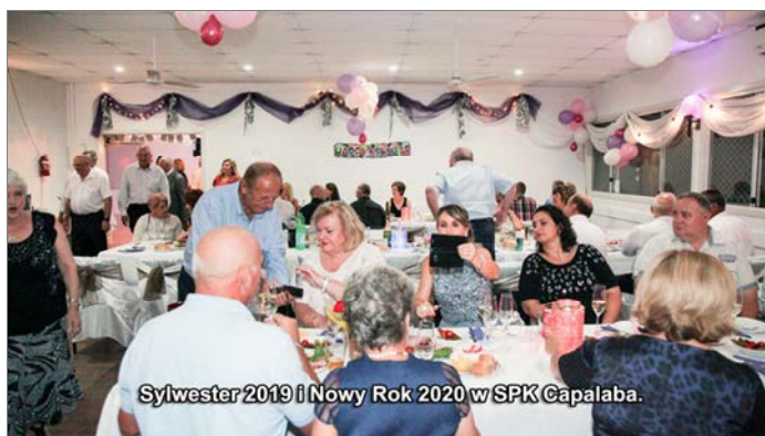
Sylwester 2019 i Nowy Rok 2020 w SPK Capalaba.