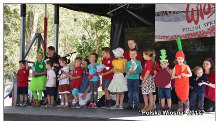
„Polska Wiosna” 2017.