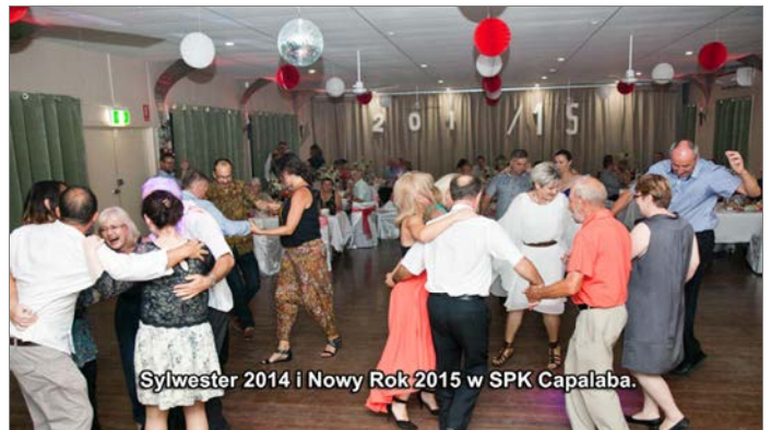
Sylwester 2014 i Nowy Rok 2015 w SPK Capalaba.