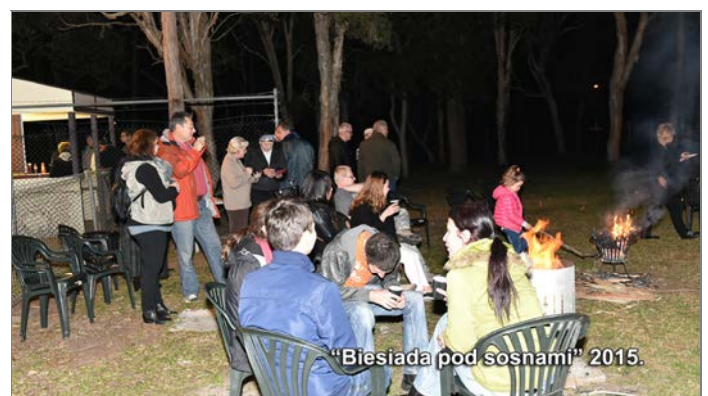
"Biesiada pod sosnami" 2015.