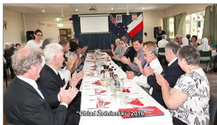
"Obiad Żołnierski" 2016.