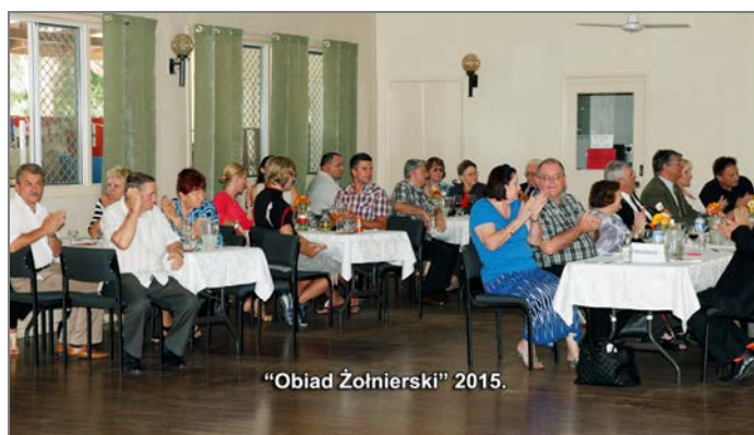
"Obiad Żołnierski" 2015.