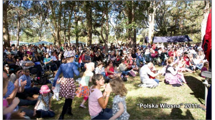
„Polska Wiosna” 2011.