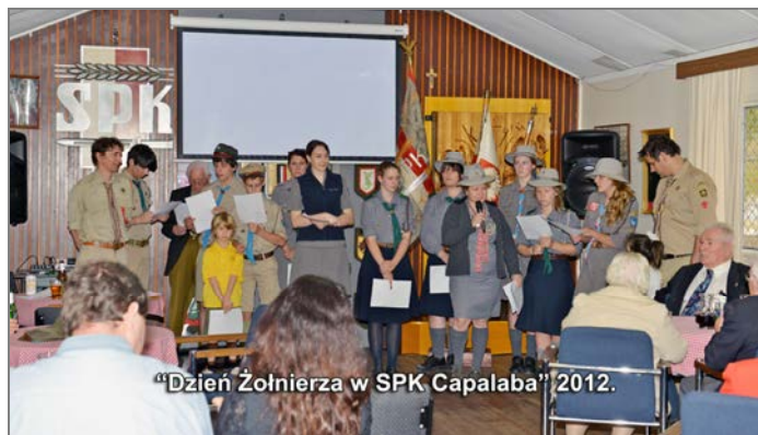
"Dzień Żołnierza w SPK Capalaba" 2012.