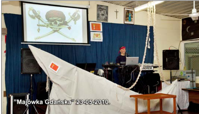
"Majówka Gdańska" 23-05-2010.

Oprócz wieczornych zimowych biesiad, organizowanych w soboty, dużą popularnością cieszyły się niedzielne Majówki, w których brali udział nie tylko członkowie SPK, ale również sympatycy naszej organizacji. Tradycja ta kontynuowana jest do dnia dzisiejszego i mamy nadzieję, że zarówno Majówki, ale również i Biesiady, będą się nadal w naszym klubie odbywały. Żeby przypomnieć sobie jak to dawniej bywało, serdecznie zapraszamy do ponownego obejrzenia zdjęć na naszej stronie: https://www.polish-spk-foundation.org.au/gallery/index.php ,