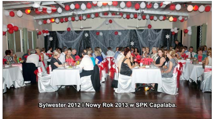
Sylwester 2012 i Nowy Rok 2013 w SPK Capalaba.