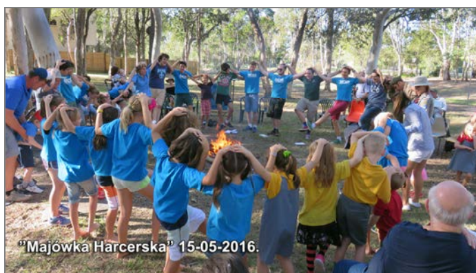
"Majówka Harcerska" 15-05-2016.