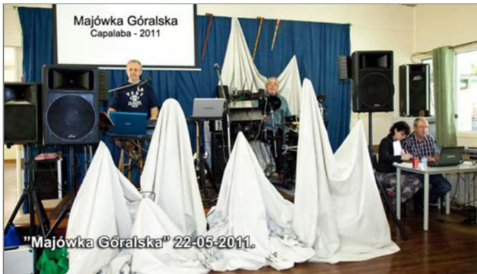
"Majówka Góralska" 22-05-2011.