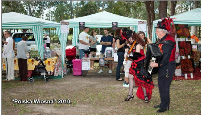
„Polska Wiosna” 2010.

Na naszej stronie internetowej, każdego roku zamieszczamy zdjęcia z Polskiej Wiosny, która jest jedną z największych polskich imprez, organizowanych w stanie Queensland. Ale niestety w ostatnich latach, a konkretnie w roku 2020 i w 2021, z powodu covidowych restrykcji, musieliśmy Polską Wiosnę odwołać. Mamy tylko nadzieję, że nasza Polska Wiosna w tym roku, będzie również udana i że do naszego klubu w Capalaba, przybędzie jeszcze większa ilość uczestników.