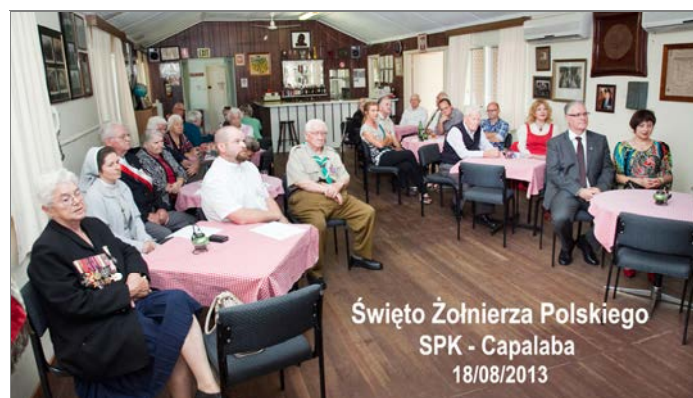
Święto Żołnierza Polskiego SPK - Capalaba 18/08/2013