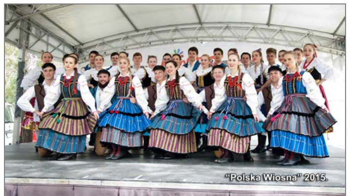
„Polska Wiosna” 2015.