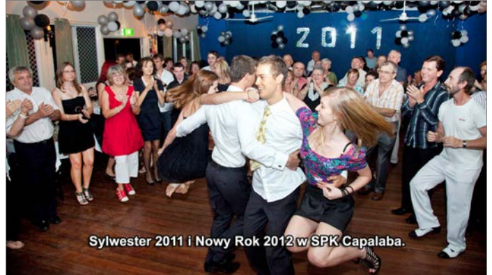
Sylwester 2011 i Nowy Rok 2012 w SPK Capalaba.