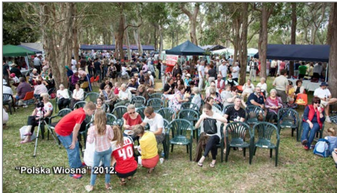
„Polska Wiosna” 2012.