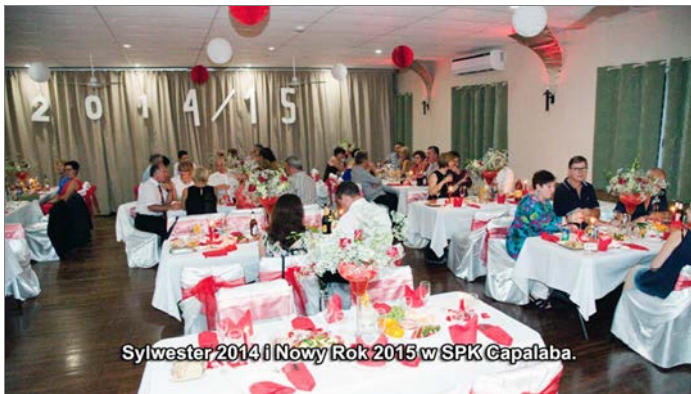
Sylwester 2014 i Nowy Rok 2015 w SPK Capalaba.