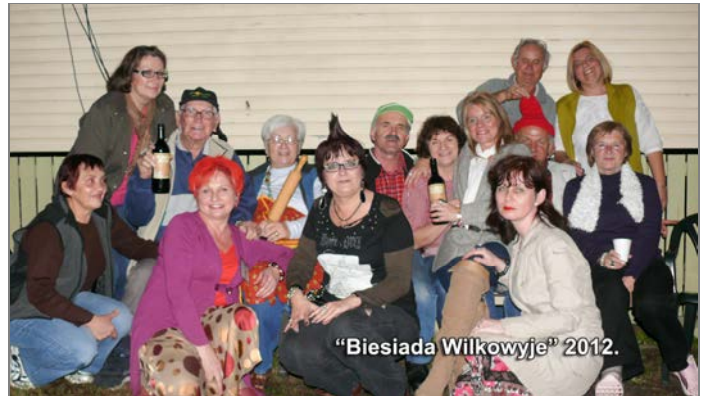
"Biesiada Wilkowyje" 2012.