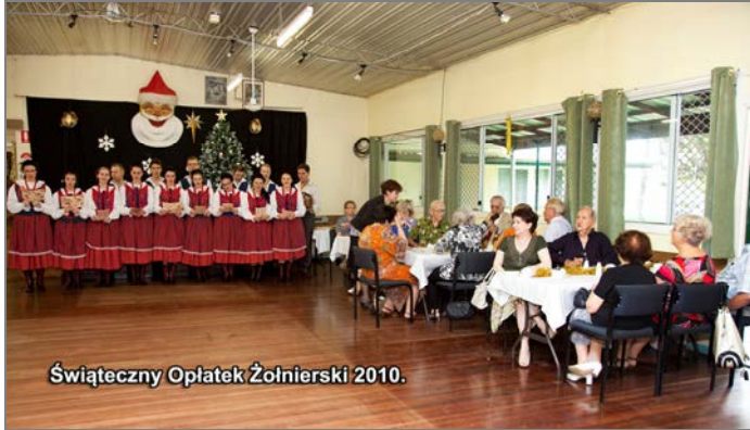
Świąteczny Oplatek Żołnierski 2010.

Oplatek Żołnierski w Klubie SPK w Capalaba, organizowany jest od wielu lat. Dla nas Polaków, przełamanie się oplatkiem z bliskimi osobami, jest zwyczajem nierozdzielnie związanym ze Świętami Bożego Narodzenia. To piękna i typowo polska tradycja, kultywowana przez wiele polonijnych organizacji, również i u nas w Australii. "Oplatek" jest symbolem szczególnie istotnym na obczyźnie, bo jest znakiem przyjaźni i miłości, a dzielenie się nim, wyraża chęć bycia razem. Podczas tych spotkań, którym często towarzyszą występy zespołów artystycznych, zgromadzeni tradycyjnie dzielą się oplatkiem i składają sobie świąteczne życzenia.