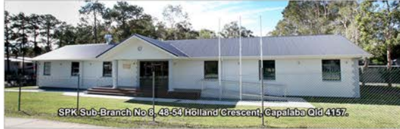
SPK Sub-Branch No 8, 48-53 Holland Crescent, Capalaba Qld 4157.

Informujemy, że SPK w Capalaba udostępniła pomieszczenia nowego klubu na uroczystości i wydarzenia.