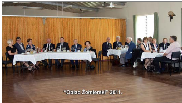
"Obiad Żołnierski" 2011.