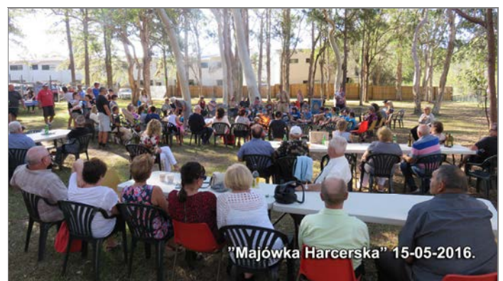
"Majówka Harcerska" 15-05-2016.