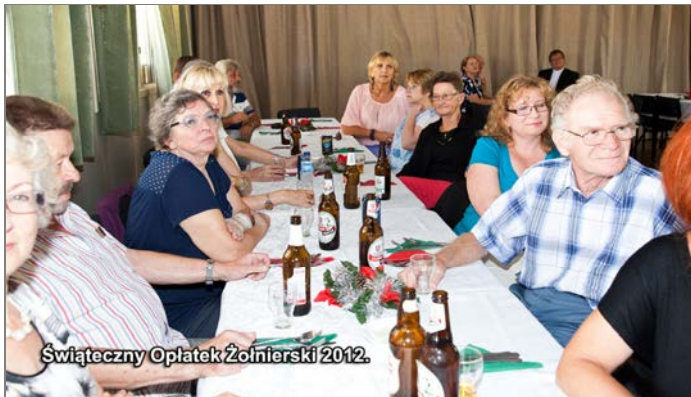
Świąteczny Oplatek Żołnierski 2012.