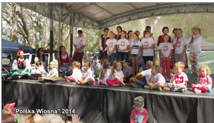
„Polska Wiosna” 2014.