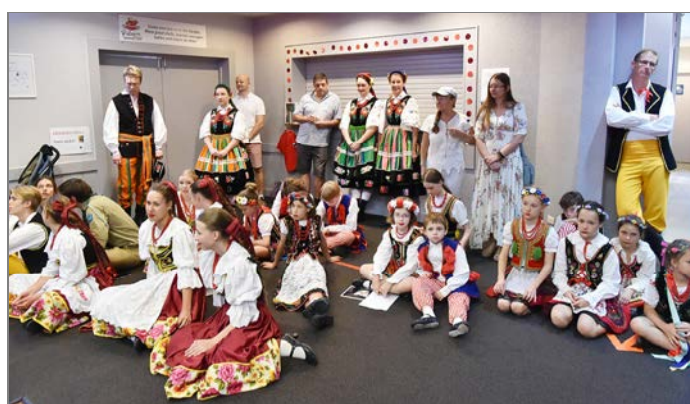
Nasza, cudownie kolorowa młodzież, na kilka minut przed występami.