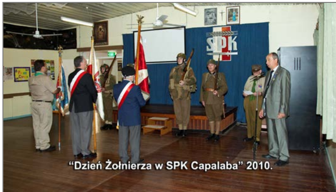
"Dzień Żołnierza w SPK Capalaba" 2010.

W poprzednich latach, Święto Żołnierza Polskiego obchodziliśmy w polskim kościele i dodatkowo w Klubie SPK w Capalaba. W latach późniejszych, gdy kombatantów zaczęło nam stopniowo ubywać, obchody Święta Żołnierza są organizowane wyłącznie w polskim kościele na Bowen Hills. W tej ważnej uroczystości, biorą również aktywny udział wszystkie poczty sztandarowe organizacji polonijnych w Brisbane.