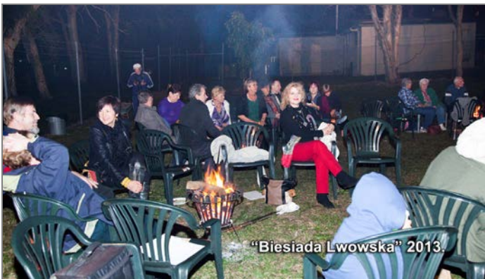
"Biesiada Lwowska" 2013.