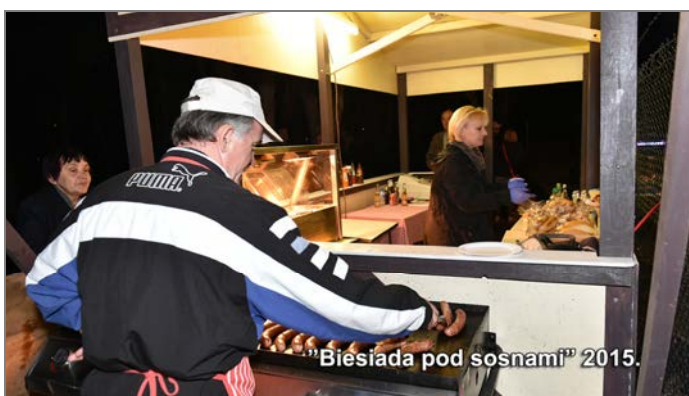
"Biesiada pod sosnami" 2015.