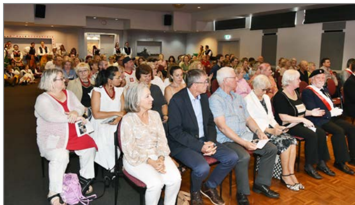
Wypełniona po brzegi, główna sala polskiego klubu "Polonia" w Milton.