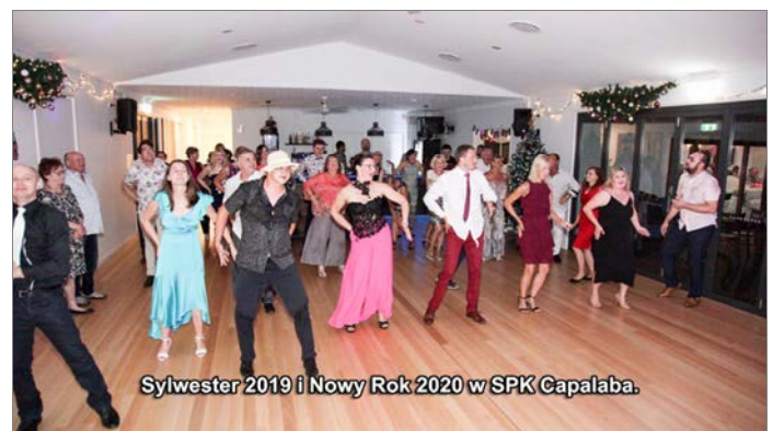
Sylwester 2019 i Nowy Rok 2020 w SPK Capalaba.