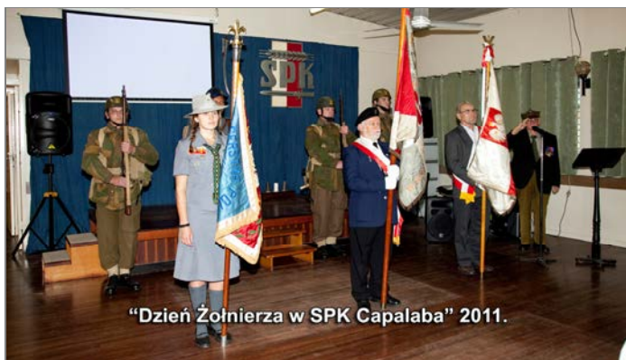
"Dzień Żołnierza w SPK Capalaba" 2011.