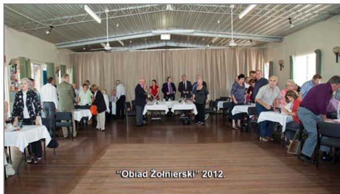
"Obiad Żołnierski" 2012.