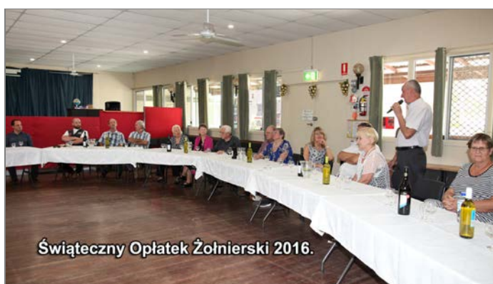
Świąteczny Oplatek Żołnierski 2016.