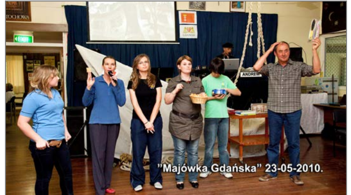
"Majówka Gdańska" 23-05-2010.