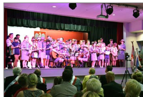
ZHP Obwód Pomorze.