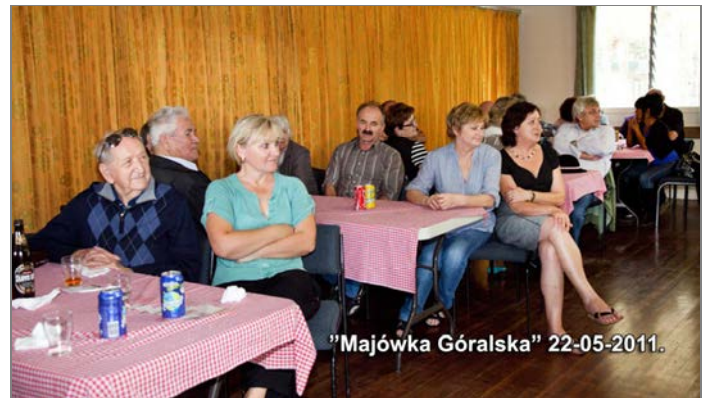
"Majówka Góralska" 22-05-2011.