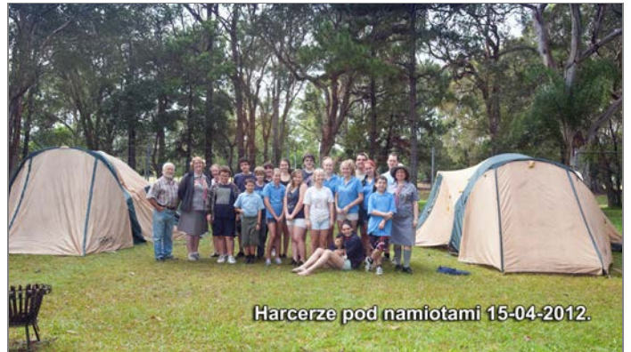
Harcerze pod namiotami 15-04-2012.