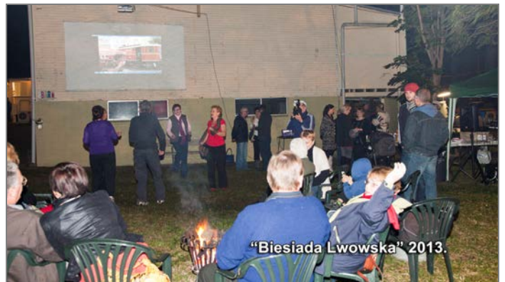
"Biesiada Lwowska" 2013.