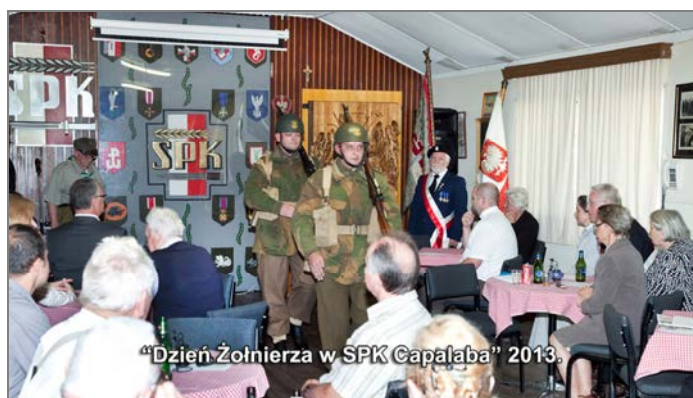
"Dzień Żołnierza w SPK Capalaba" 2013.