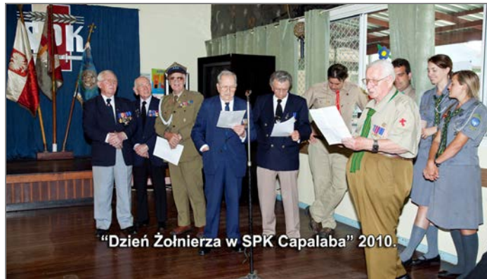
"Dzień Żołnierza w SPK Capalaba" 2010.