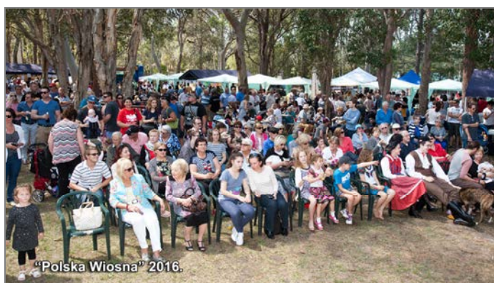
„Polska Wiosna” 2016.