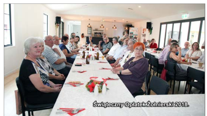
Świąteczny Oplatek Żołnierski 2018.