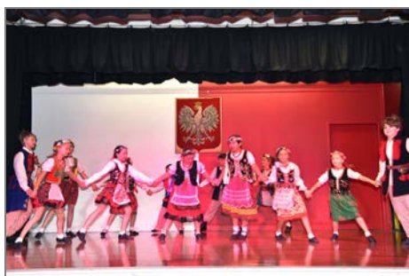
Zespół "Małe Brisbane".