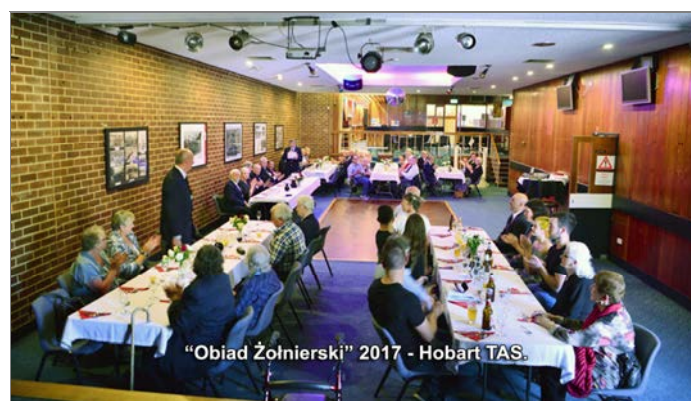
"Obiad Żołnierski" 2017 - Hobart TAS.